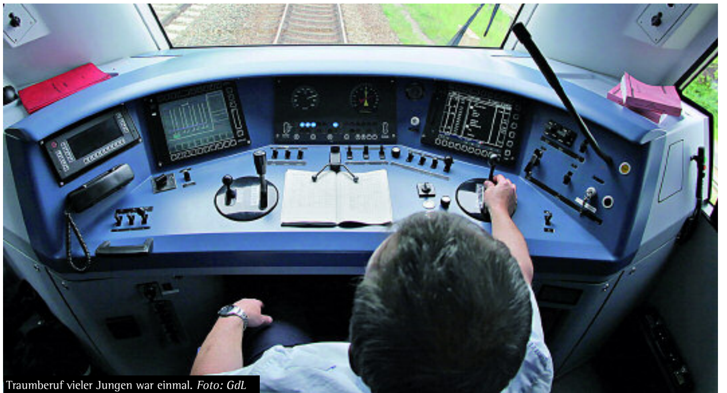
Traumberuf vieler Jungen war einmal.

Vor diesem Hintergrund darf es nicht verwundern, wenn die Forderung nach einer strikten Begrenzung der Überstundenzahl pro Jahr und nach einem Abbau