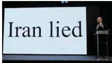
Benjamin Netanjahu liefert „Beweise“ mit ähnlicher Show wie Colin Powell

Ein Dorn im Auge der Nachbarstaaten Saudi-Arabiens und Israels, die mit